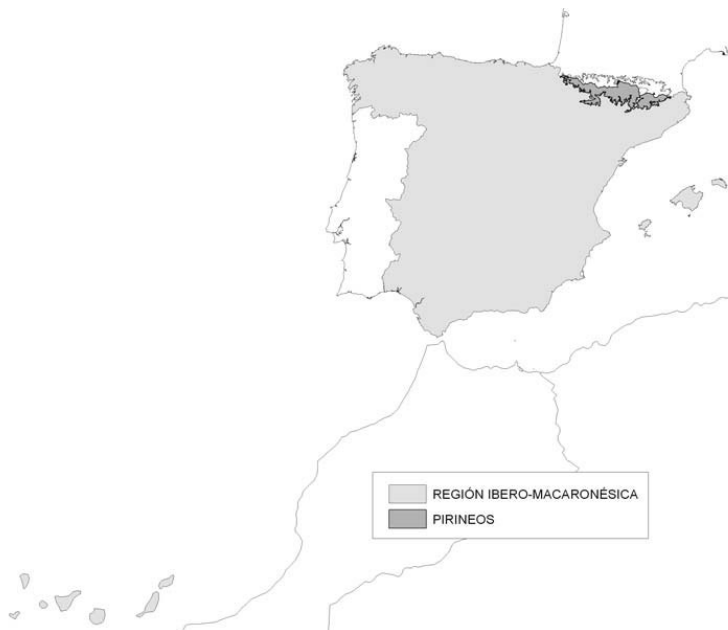
Figura 1. Regiones ecológicas de ríos y lagos

La región de los Pirineos queda delimitada por la zona pirenaica situada por encima de 1.000 m de altitud y comprende parte de la cuenca del Ebro y de las Cuencas Internas de Cataluña, según se detalla en la figura 2.