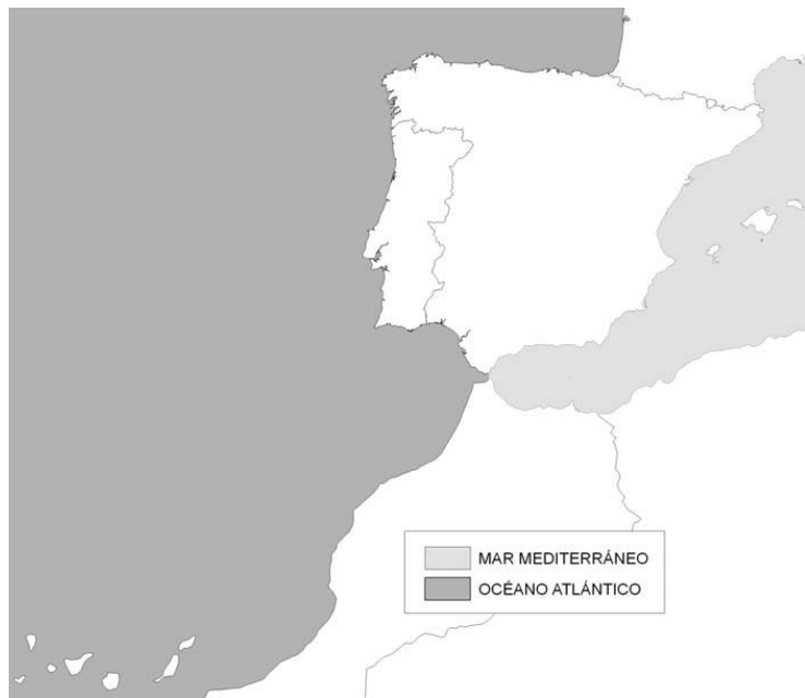
Figura 3. Regiones ecológicas de aguas de transición y costeras

Las regiones ecológicas de las aguas de transición y costeras serán el Océano Atlántico y el Mar Mediterráneo, como se muestra en la figura 3.