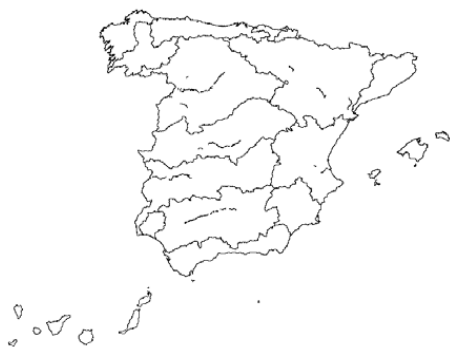
Tipo 17. Grandes ejes en ambiente mediterráneo