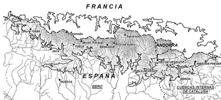
Figura 2. Detalle de la parte española de la región ecológica Pirineos

La región de los Pirineos queda delimitada por la zona pirenaica situada por encima de 1.000 m de altitud y comprende parte de la cuenca del Ebro y de las Cuencas Internas de Cataluña, según se detalla en la figura 2.