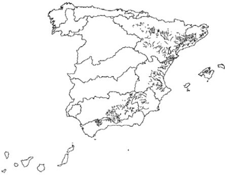
Tipo 9. Ríos mineralizados de la baja montaña mediterránea