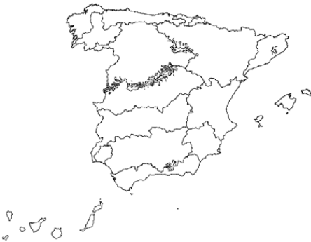
Tipo 11. Ríos de montaña mediterránea silíceas