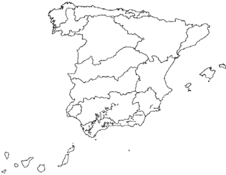
Tipo 7. Ríos mineralizados mediterráneos de baja altitud