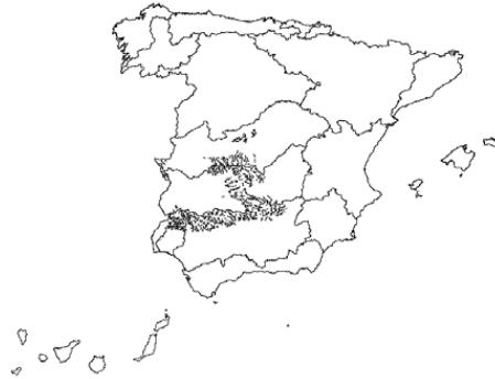
Tipo 8. Ríos de la baja montaña mediterránea silíceas