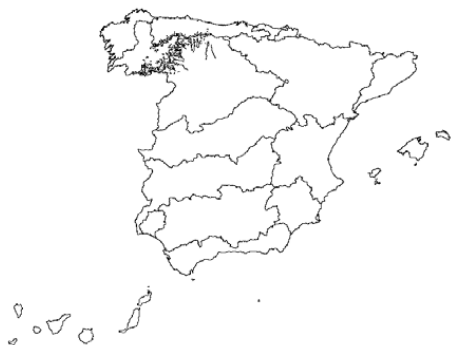
Tipo 25. Ríos de montaña húmeda silíceo