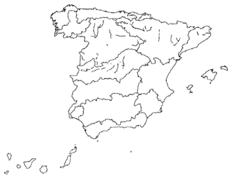
Tipo 15. Ejes mediterráneo-continentales poco mineralizados