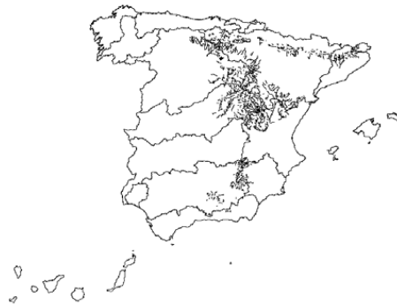
Tipo 12. Ríos de montaña mediterránea calcárea